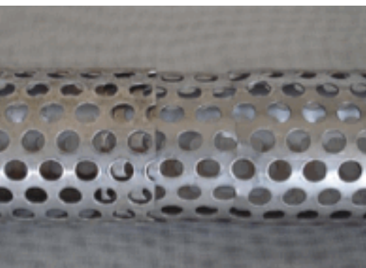
Tubo fessurato Dettaglio dell'innesto tra due spezzoni