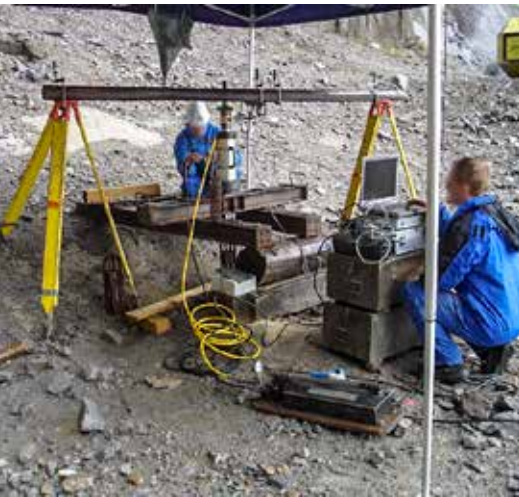
Campo prove con installazione della postazione di trazione e acquisizione dati

La forza massima misurata rappresenta il carico di rottura del materiale costituente il tubo; da tale analisi se ne ricava che i tubi fessurati testati - ognuno con le proprie caratteristiche di resistenza - assicurano l'adesione tra cemento iniettato e parete del foro, senza generare superfici di rottura preferenziali all'interfaccia tra parete interna del tubo/boiaccia e parete esterna del tubo /boiaccia.