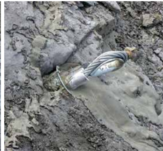
Dettaglio dell'imboccatura del foro dopo la cementazione. Si nota il collarino antitaglio