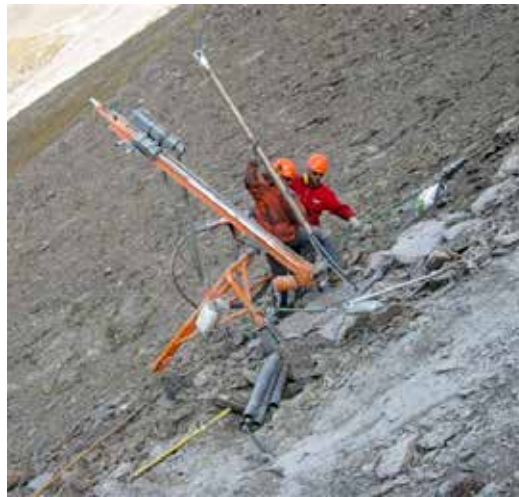
Cantiere alpino in materiale litoido fratturato; infissione del tubo stabilizzatore contenente un tirante in trefoli