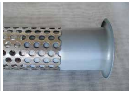
Dettaglio del collarino antitaglio