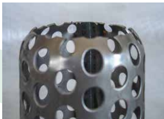
Dettaglio della punta rastremata