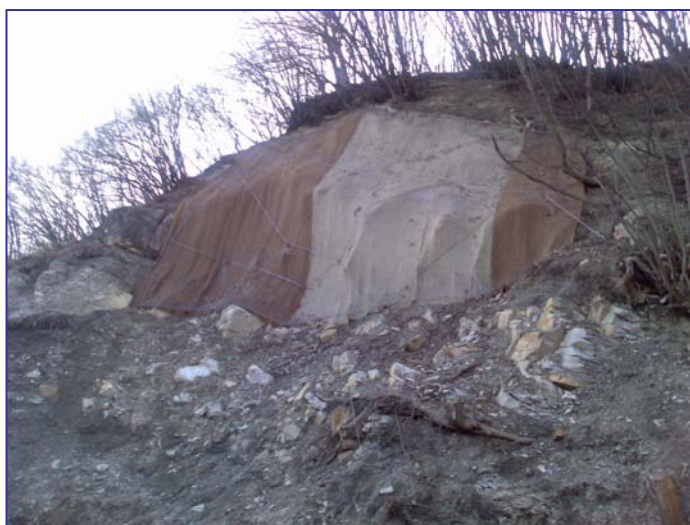
▲ Parte apicale della scarpata: rinforzo corticale con geocomposito, chiodi e funi