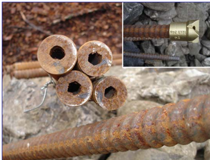
▲ Barre autopercoranti cave e "scalpello"