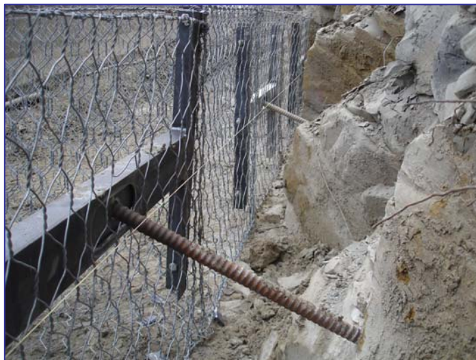
▲ Gabbionata chiodata – vista posteriore