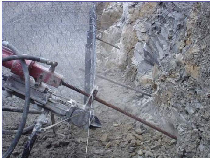
▲ Gabbionata chiodata: vista posteriore

Materiali impiegati: Gabbioni con sistema di chiodatura, geocomposito antiersivo tipo R.E.C.S. Agave e Cocco