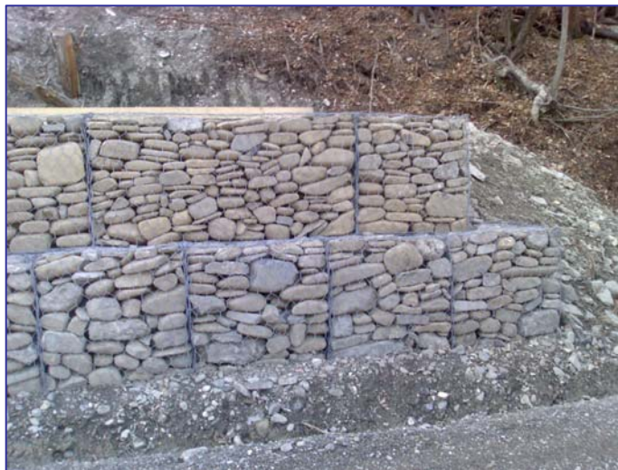
▲ Base della scarpata: gabbionata chiodata