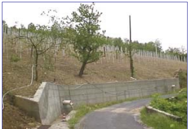
▲ Versante dopo l'intervento