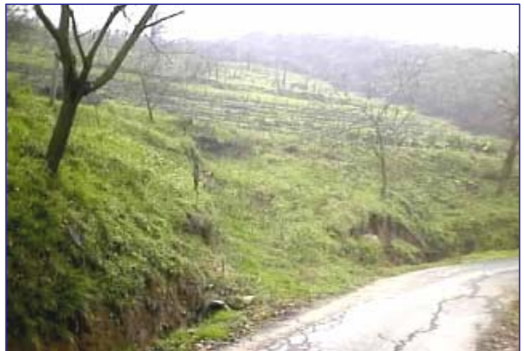
▲ Versante prima dell'intervento