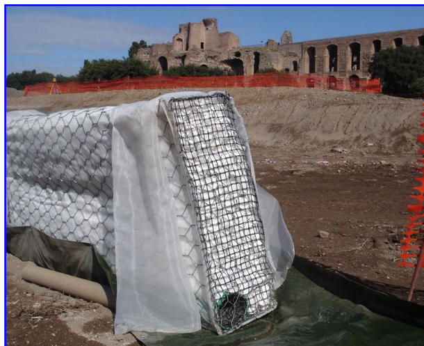
Foto 3 - Applicazione nel controllo dell'oscillazione dei livelli di falda con bassi gradienti disponibile per la linea di deflusso