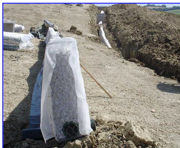
Foto 1 - Pannello drenante Gabbiodren®T nella bonifica di un versante per la realizzazione di un campo fotovoltaico