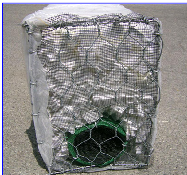
Foto 2 - Gabbiodren®T dimensioni 200x50x30, ideale per la bonifica agraria e per il controllo del livello di falda nei vigneti