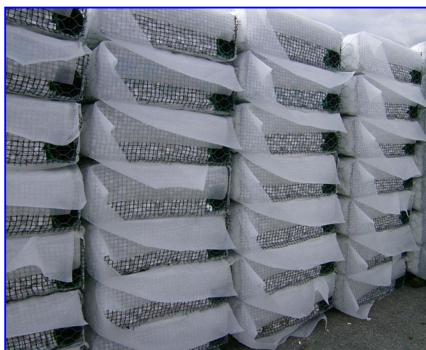
Foto 4 - L'ordine e la pulizia della zona di stoccaggio dei materiali in cantiere danno buona rappresentazione delle caratteristiche di praticità e gestione del Sistema Gabbiodren®