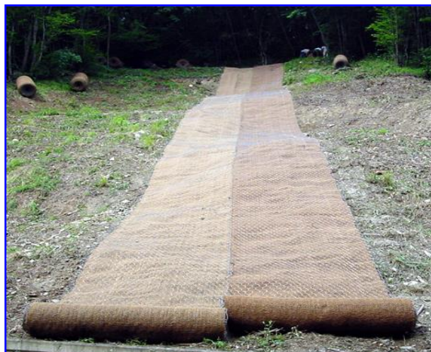
Foto 1 – Fasi iniziali di stesa e posa in opera del Geocomposito R.E.C.S.® in un intervento di rinforzo corticale di un pendio in forte erosione

La Borghi Azio® SRL fornisce ai progettisti interessati supporto tecnico in fase progettuale .