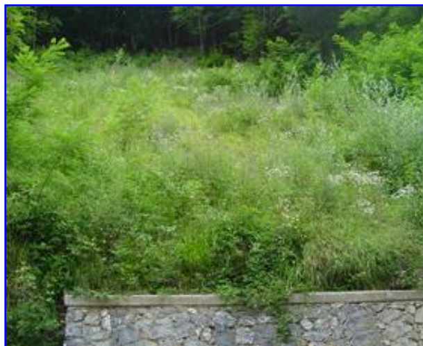
Foto 3 – Intervento a regime dopo le fasi di idrosemina e inerbimento. Si noti la diffusa copertura vegetale che funge da protezione verso i fenomeni di dilavamento e perdita di suolo