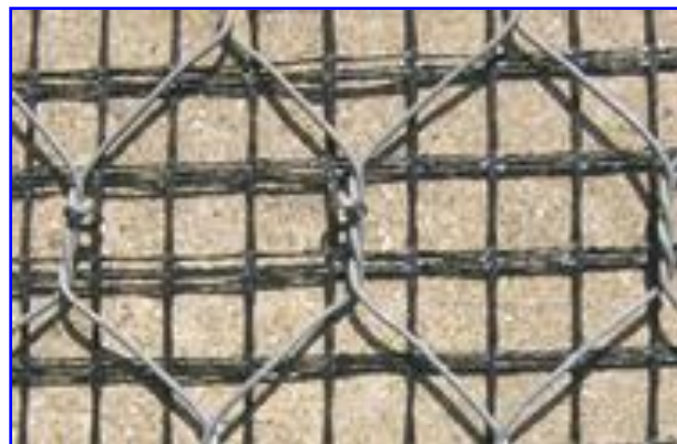
Foto 4 - R.E.C.S.® GSFT