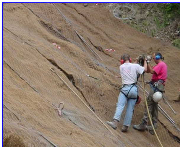
Foto 2 – Realizzazione del sistema di chiodatura per l'ancoraggio del rinforzo corticale mediante utilizzo di fioretto tipo Toyo e barre autoperforanti di diametro Ø32mm