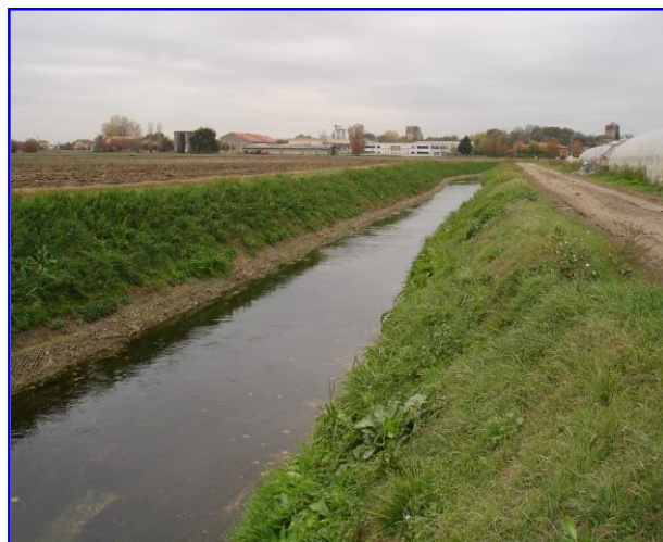
Foto 6 - Situazione del canale dopo l'intervento