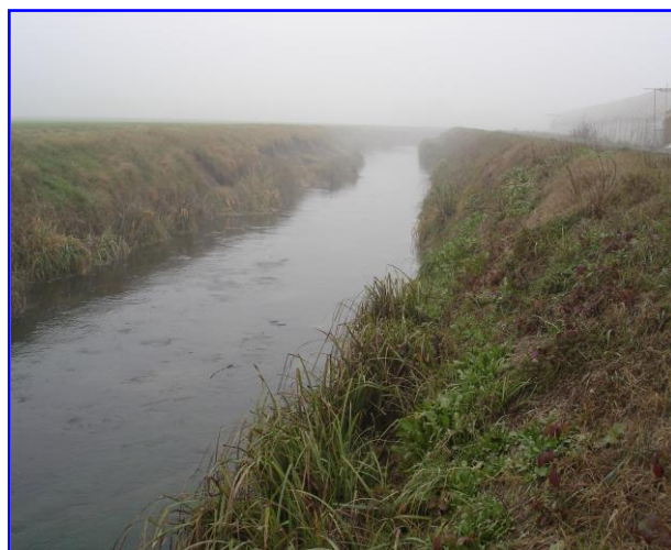
Foto 4 - Situazione del canale prima dell'intervento