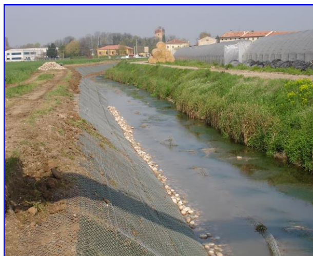
Foto 5 - Fasi realizzative dell'intervento in sponda destra; posa del geocomposito e presidio al piede